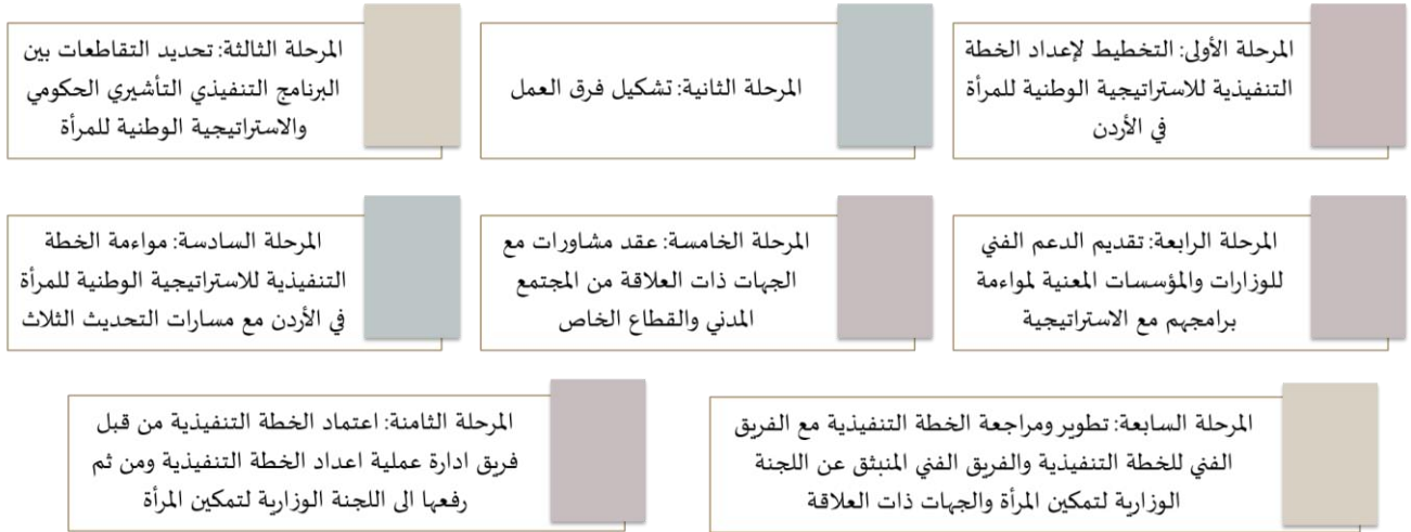
الشكل رقم (5): مراحل إعداد واعتماد الخطة التنفيذية للاستراتيجية الوطنية للمرأة في الأردن (2023-2025)

الشكل التالي يوضح مراحل عملية إعداد الخطة التنفيذية للاستراتيجية الوطنية للمرأة في الأردن: