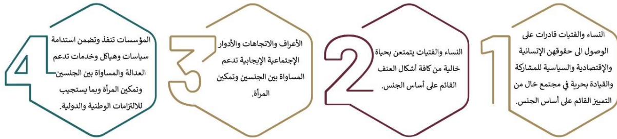
الشكل رقم (1): أهداف الاستراتيجية الوطنية للمرأة في الأردن (2020-2025)

صادقت الحكومة الأردنية في آذار 2020 على الاستراتيجية الوطنية للمرأة في الأردن (2020-2025)، والتي تعتبر الإطار الوطني الذي يتم من خلاله متابعة الجهود الوطنية الرامية إلى تطوير السياسات والبرامج التي تؤدي إلى تعزيز حقوق النساء والفتيات وتمكينهن من المشاركة الكاملة والفاعلة في المجتمع. وقد بُنيت الاستراتيجية التي تم إعدادها بنهج تشاركي على الأولويات التي تم التوافق عليها من خلال مشاورات وطنية واسعة، بالإضافة إلى مواءمتها مع أهداف التنمية المستدامة 2030 وخاصة الهدف الخامس بشأن المساواة بين الجنسين وتمكين كل النساء والفتيات، والأهداف الأخرى ذات العلاقة. توفر الاستراتيجية إطار للعمل الشامل والفاعل من خلال وضع السياسات وتوجيه الموازنات والتمويل نحو الأولويات المتفق عليها.